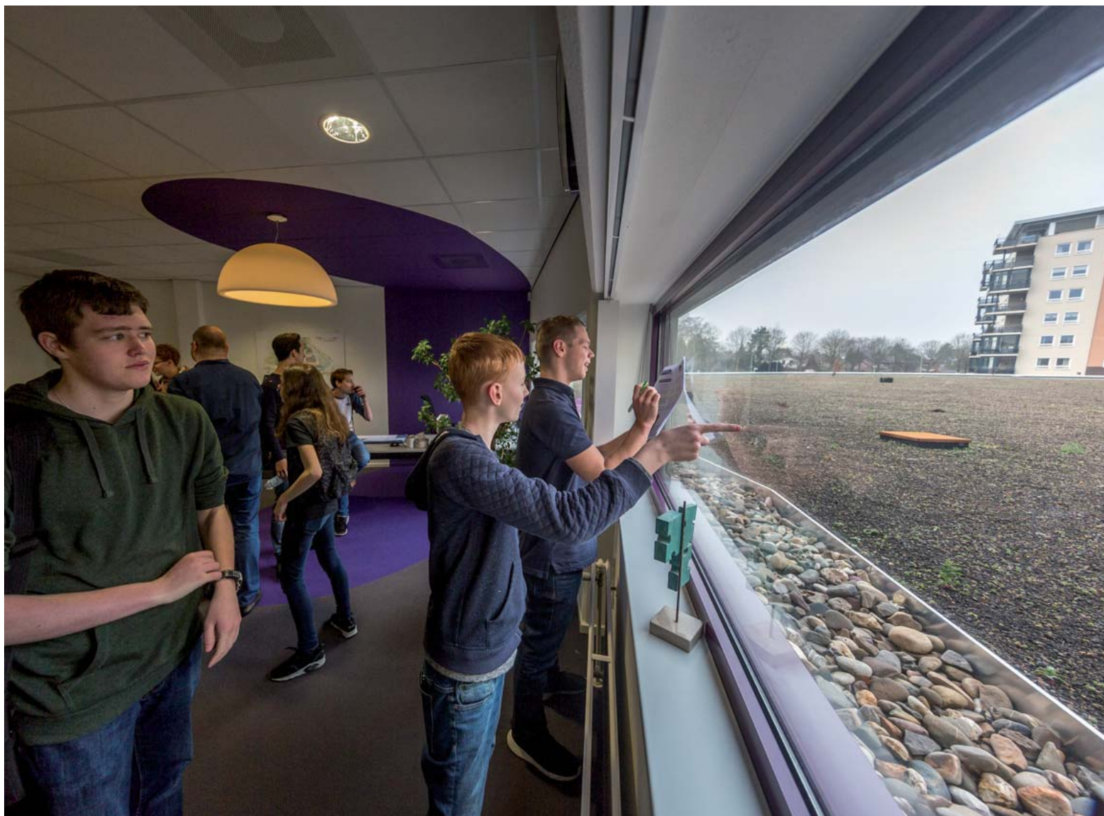
Het dak van het Burgerhoes in Landgraaf is van gras, constateren scholieren die het gebouw scannen op duurzaamheid.